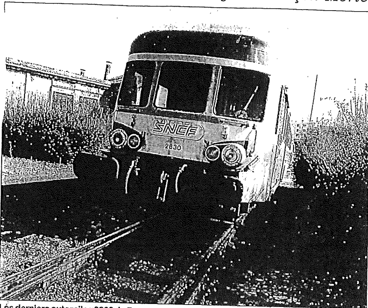
Les derniers autorails x2800 de France ont été mis à la retraite le 6 avril, en Franche-Comté.

Une association de passionnés de chemin de fer mûrit le projet de faire revenir un autorail x2800 sur la ligne Besançon-Morteau pour des trajets touristiques.